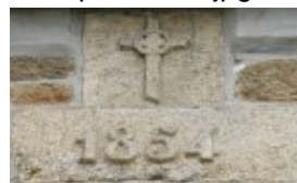
Date 1854 et croix <a

<a href='http://paroisse-guingamp.catholique.fr/sites/paroisse-guingamp.catholique.fr/IMG/jpg/croix_et_1854.jpg' title="" type="image/jpeg">