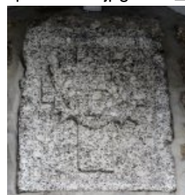
Croix au-dessus de la porte du n° 12 rue de Montbareil, près de l'entrée du monastère.

Certes, la notion de « coeur » héritée de la Bible dépasse de très loin toute sentimentalité. Bien plus, cette spiritualité invite à l'accueil et à l'amour du prochain, au service, à l'éducation, à la prise en charge de toute détresse humaine. Tout cela a été mis en chantier, avec des hauts et des bas, au monastère de Montbareil.