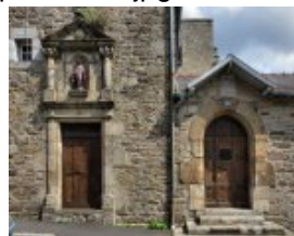
Monastère de Montbareil : porte d'entrée du monastère

href="http://paroisse-guingamp.catholique.fr/sites/paroisse-guingamp.catholique.fr/IMG/jpg/montbareil_porte_haut.jpg" title="" type="image/jpeg">