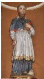
Statue de St François de Sales (dans le chœur, à d.)

Pour ce qui concerne Monsieur Vincent, ou Saint Vincent de Paul (vers 1581-1660), on connaît son dévouement au service des pauvres. Il a notamment fondé les Soeurs de la Charité (ou Soeurs de Saint Vincent de Paul), dont l'emblème est un Christ en croix sur fond de coeur enflammé.