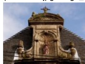
Partie supérieure de la façade de la chapelle avec statue de la Vierge

href='http://paroisse-guingamp.catholique.fr/sites/paroisse-guingamp.catholique.fr/IMG/jpg/vierge_du_frontispice.jpg' title="" type="image/jpeg">