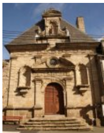
Façade de la chapelle (rue Montbareil) <a

href='http://paroisse-guingamp.catholique.fr/sites/paroisse-guingamp.catholique.fr/IMG/jpg/detail_frontisp.jpg' title="" type="image/jpeg">