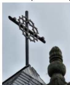
Croix et couronne d'épines au sommet de la façade de la chapelle <a