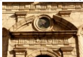
Détail de la façade de la chapelle (rue Montbareil)

href='http://paroisse-guingamp.catholique.fr/sites/paroisse-guingamp.catholique.fr/IMG/jpg/detail_frontisp.jpg' title="" type="image/jpeg">