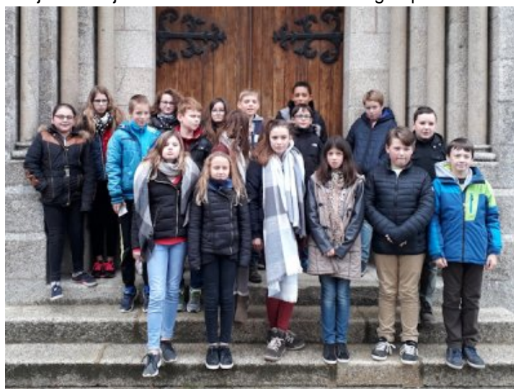
Une partie des jeunes présents à Timadeuc

Pour cela, nous sommes allés en retraite à l'Abbaye de Timadeuc les 2 et 3 décembre. Dominique nous accompagnait. Nous y avons rejoint des jeunes de Bourbriac et de Guingamp.