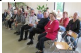
Une partie des personnes présentes (1)

<a href='http://paroisse-guingamp.catholique.fr/sites/paroisse-guingamp.catholique.fr/IMG/jpg/img_1940.jpg' title="" type="image/jpeg">