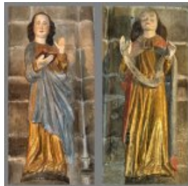
Digemer d'ar Werc'hez : Mari (tu kleiz) hag an Ael Gabriel (a-zehou)

<dl class='spip_document_75 spip_documents spip_documents_right' style="float:right;"> <a href="sites/paroisse-guingamp.catholique.fr/IMG/jpg/div_zelwenn_digemer_d_ar_werc_hez.jpg" title="" type="image/jpeg">