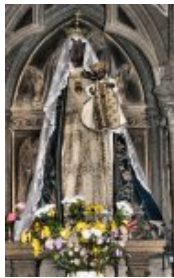
Gwerc'hez du Gwengamp (portal an Itron Varia, tu an Hanternoz)

Sevel a ra delwennoù an Ebestel d'an naontekvet kantved (Ogée)