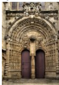
Portal ar C'hornog, stumm an Azginivelezh.

<dl class='spip_document_82 spip_documents spip_documents_right' style="float:right;"> <a href="sites/paroisse-guingamp.catholique.fr/IMG/jpg/portal_ar_c_hornog_stumm_an_azginivelezh.jpg" title="" type="image/jpeg">